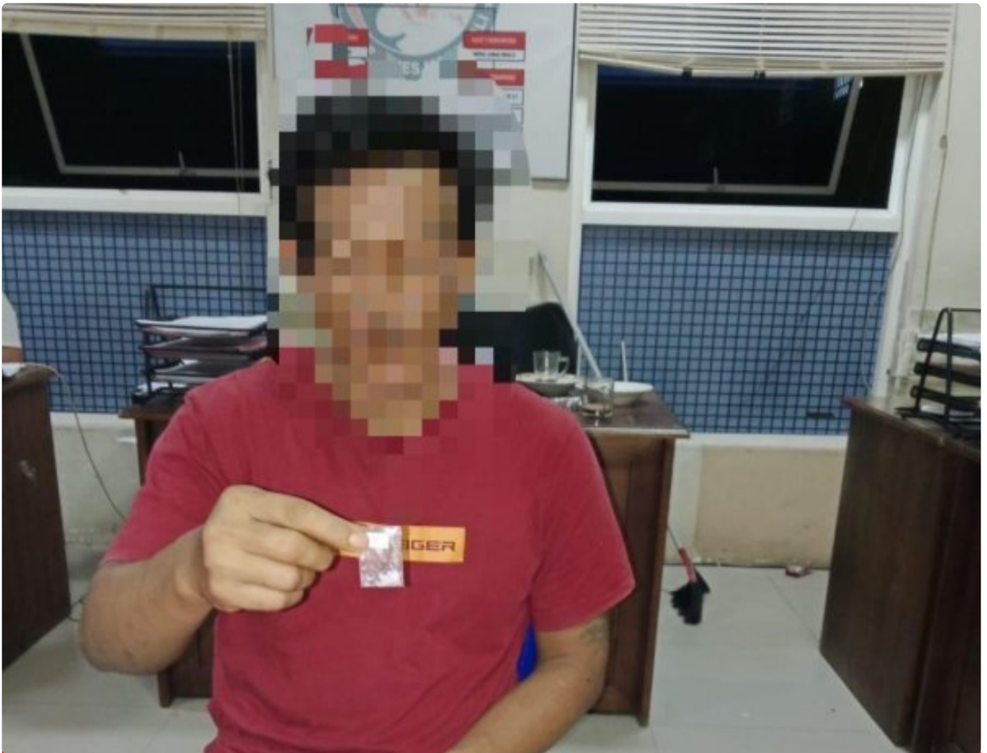
Pelaku terlibat Sabu terancam penjara seumur hidup

Morowali, 15 Januari 2025 – Polres Morowali berhasil mengungkap